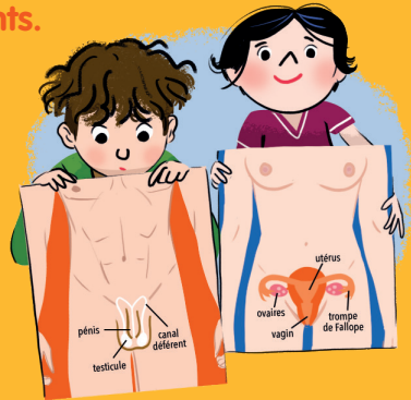
Les organes vus de l'intérieur.

Les garçons naissent avec un pénis, et les filles avec une vulve : ce sont les organes sexuels. À la puberté, les organes sexuels fabriquent des substances appelées hormones, qui ont des effets sur le corps. Ces effets ne sont pas les mêmes : par exemple, la voix des garçons mue et devient plus grave, et la poitrine des filles se développe.