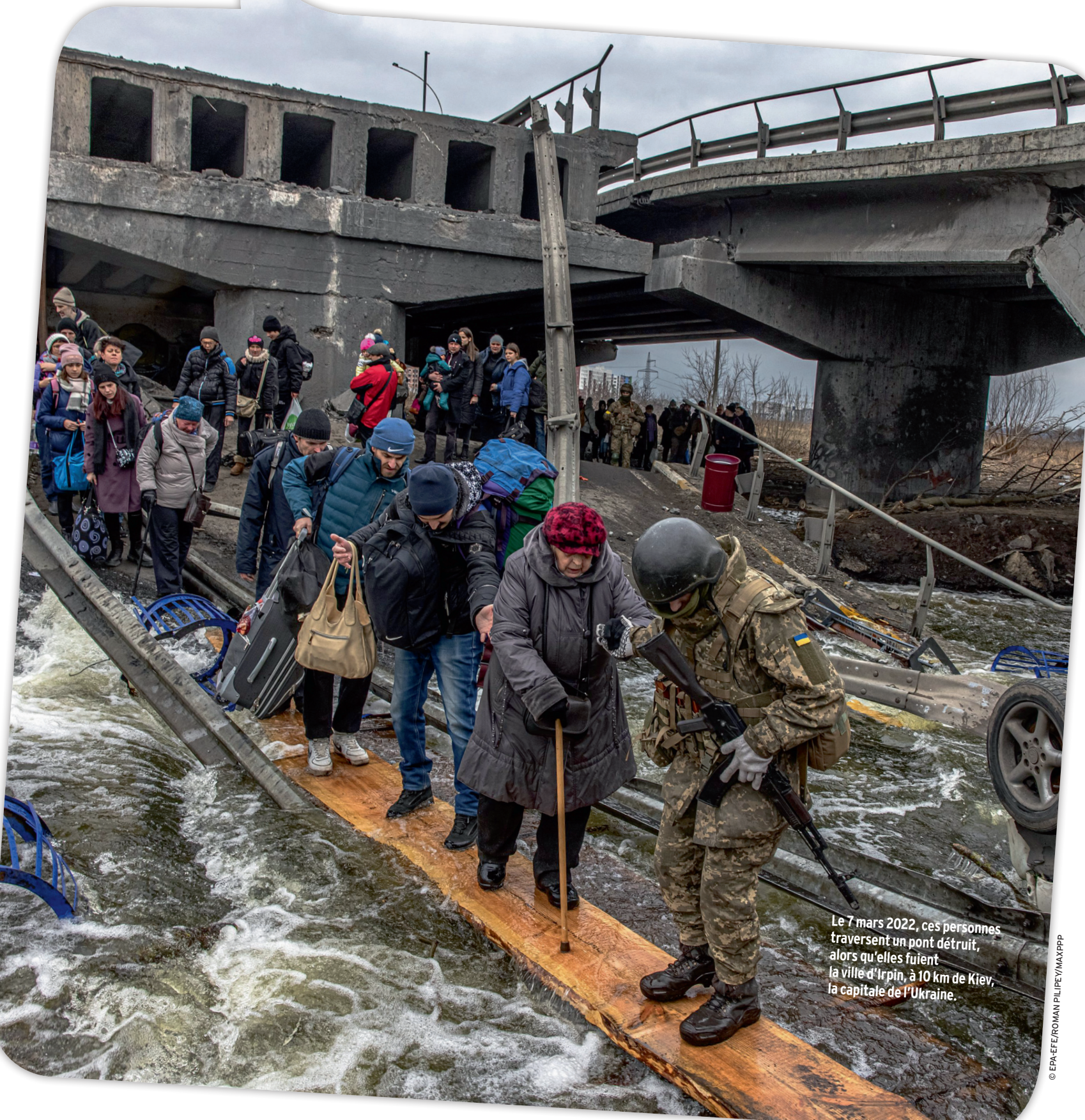
Le 7 mars 2022, ces personnes traversent un pont détruit, alors qu'elles fuient la ville d'Irpin, à 10 km de Kiev, la capitale de l'Ukraine.

D'abord, elle montre que le président russe ne comprend que le langage de la force. Il a décidé d'écraser l'Ukraine, et impossible de négocier avec lui pour qu'il change d'avis. Donc, s'il veut faire pareil un jour avec d'autres pays, il ne reculera pas non plus. La menace